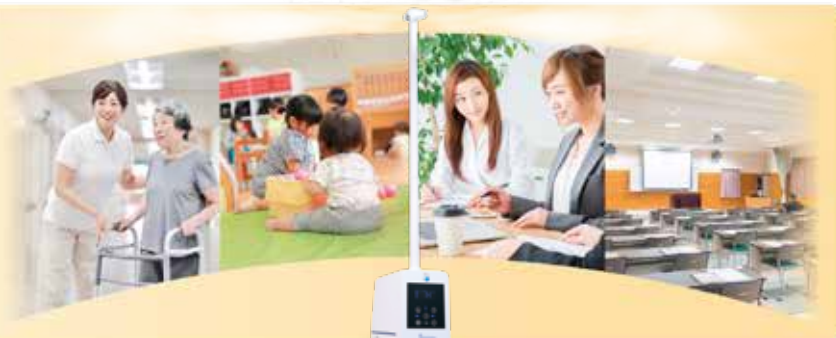
噴霧イメージ: クリアランス400D+ハイノズル(オプション)

医療施設(病院・クリニックなど)・老人福祉施設・学校・ 学習塾・飲食店・オフィス・ホテル・ペットショップ・理容美容室・ 温浴施設・パチンコ店・カラオケ店・各種娯楽施設・ゴミ 置き場・禁煙所・トイレ・生花栽培・食品加工工場・各種製造 工場・各種実験施設など、そのほか用途多数あります。