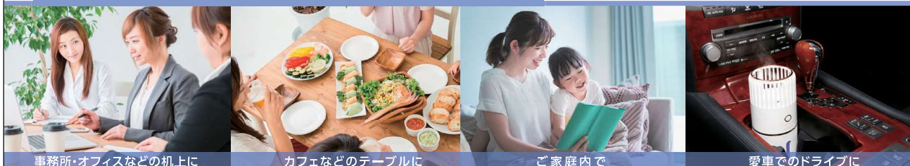
事務所・オフィスなどの机の上に